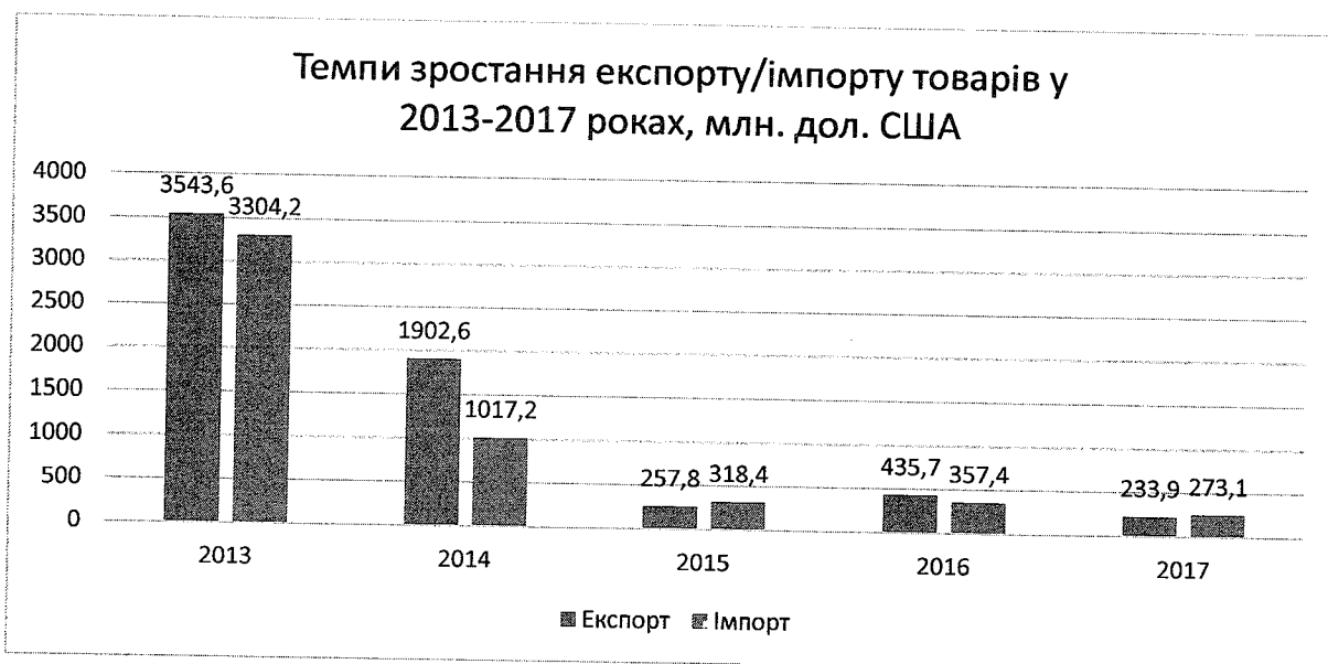
Рисунок 1.2. Темпи зростання (зниження) експорту-імпорту товарів у 2013-2017 роках

Динаміку експорту та імпорту товарів області у 2013-2017 роках представлено на рис. 1.2.