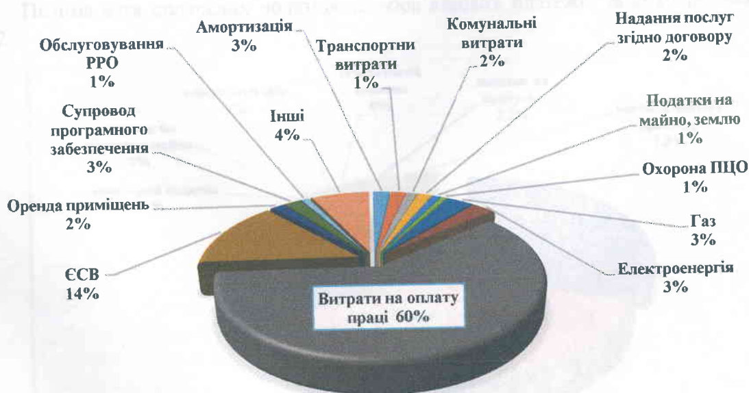
Рис.1 Питома вага витрат у загальному обсягу витрат за 2019 рік

Витрати відокремлених підрозділів за 2019 рік склали 56,2 млн.грн. Питома вага статей витрат наведена на рис. 1